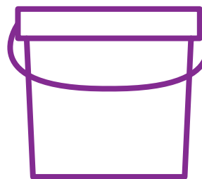
600tk purgis (18 x 20 cm)